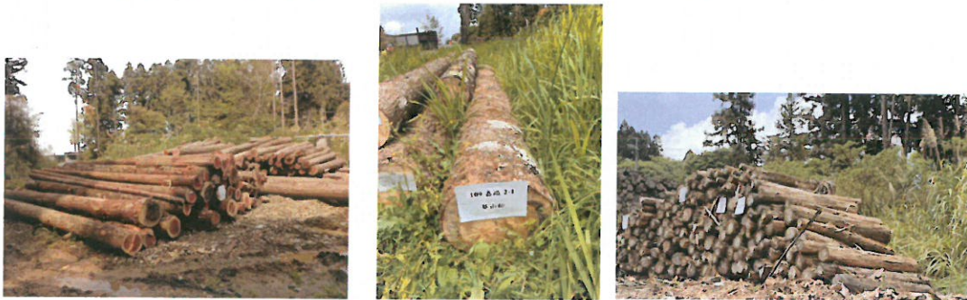
柳杉及華山松、紅檜堆置情形