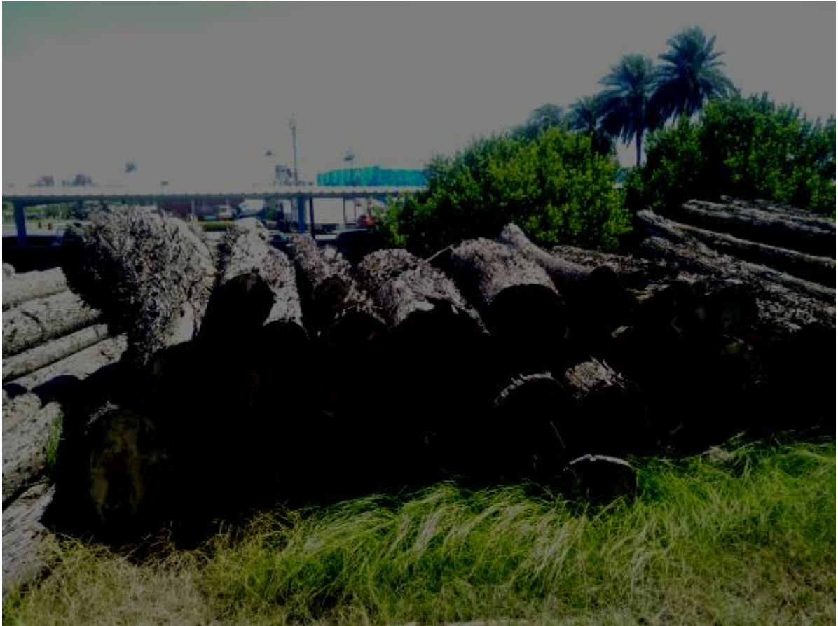
108羅疏4-1號 林產物相片(4/4)