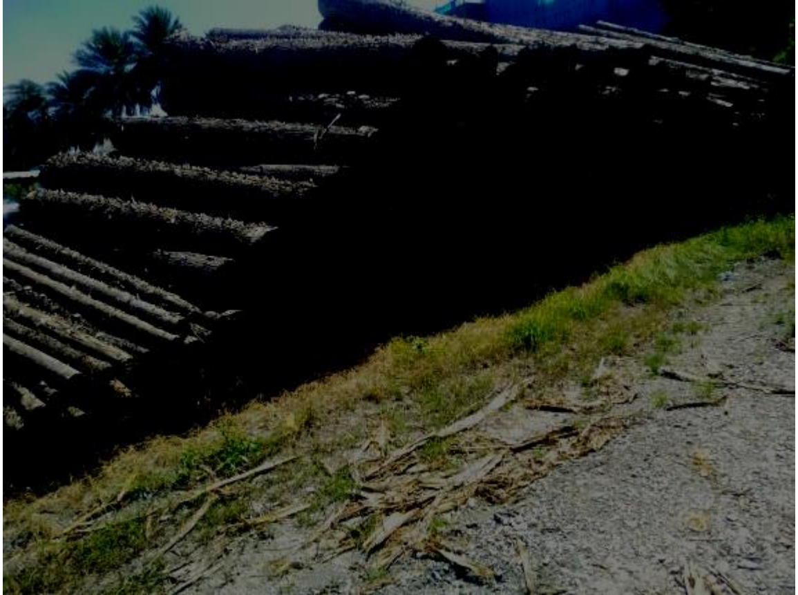
108羅疏4-1號 林產物相片(2/2)